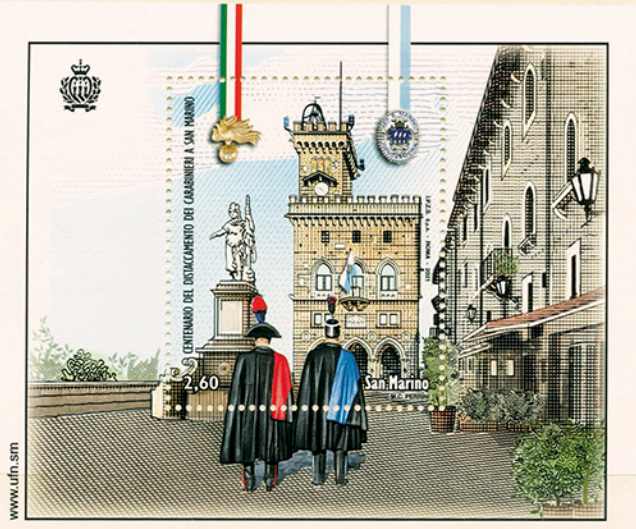
CENTENARIO DEL DISTACAMENTO DEI CARABINIERI A SAN MARINO