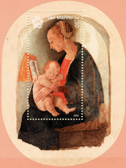
Raffaello, Madonna con Bambino Casa Santi, Urbino